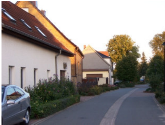
Foto der Wohnstraße zum Grundstück in Richtung Ortsmitte