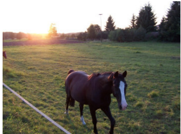
„Nachbar“ vom Grundstück auf der Rückseite