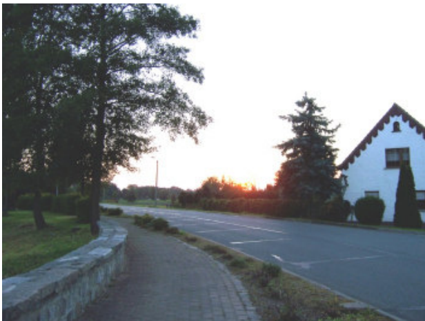
Hauptstraße im Ortsbereich