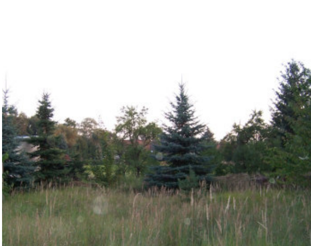
Blick über die Grundstücksgrenzen nach hinten

Kaufobjekt Glockengasse 4 – 06773 Schmerz