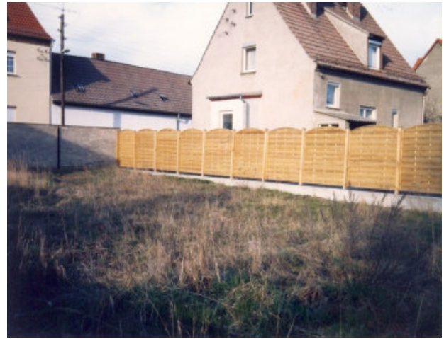
Blick zum linken Nachbarn